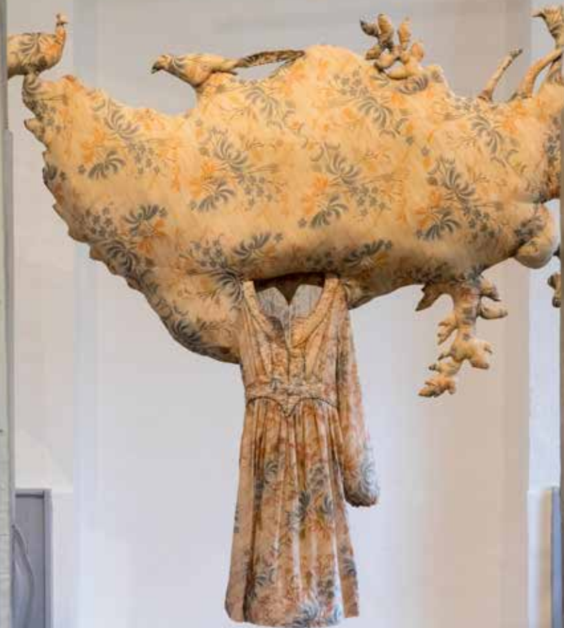
Émilie Faïf, Excroissance , 2006