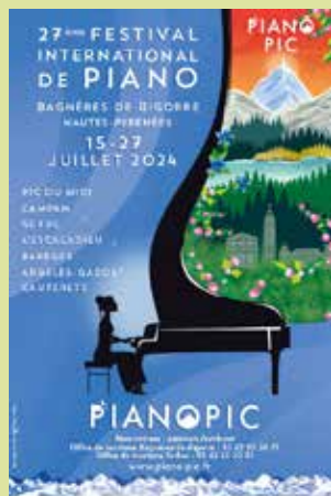
Dans le cadre du festival Piano Pic