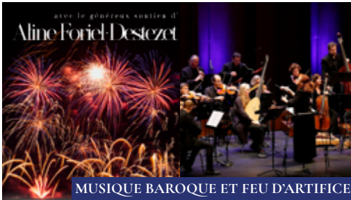
MUSIQUE BAROQUE ET FEU D'ARTIFICE