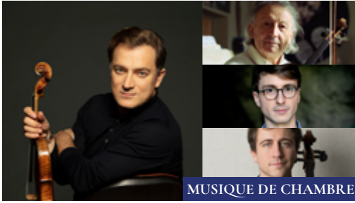
MUSIQUE DE CHAMBRE