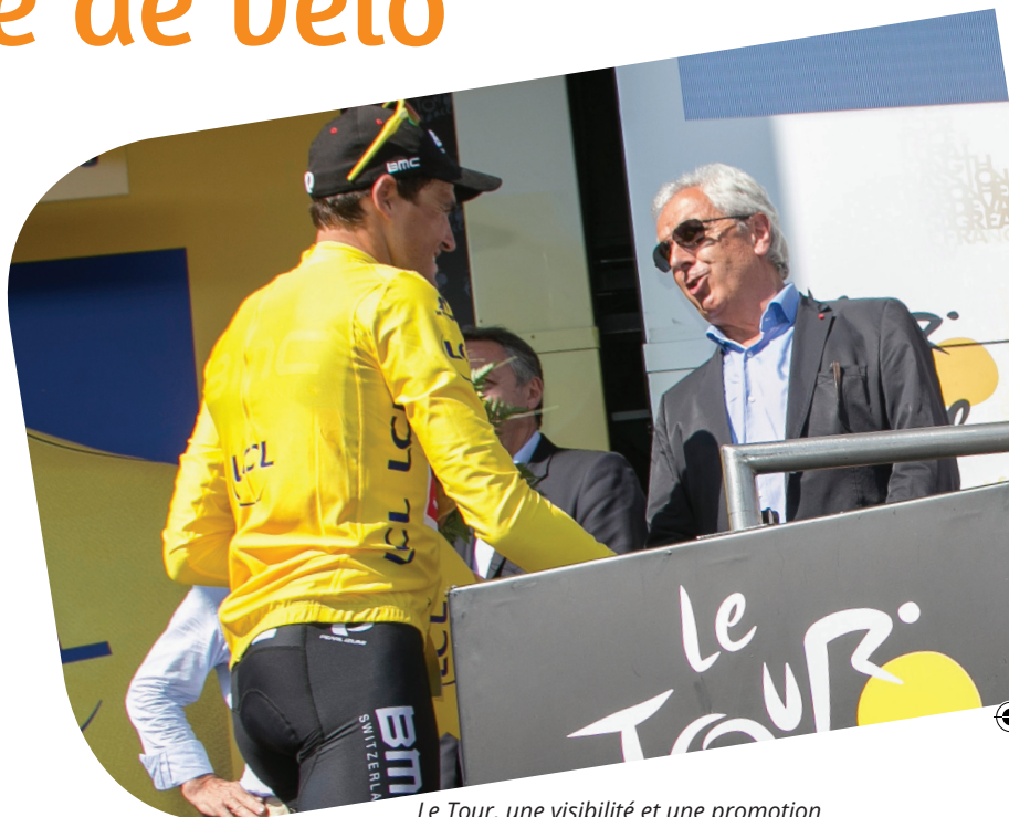
Le Tour, une visibilité et une promotion incomparables pour les Hautes-Pyrénées.

Enfin, nous organisons avec l'Office Départemental des Sports et Hautes-Pyrénées Tourisme Environnement, et grâce à l'aide de nombreux partenaires, deux événements cyclo ouverts au grand public : la Montée du Géant et le Pyrénées Cycl'n Trip.