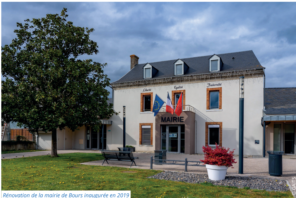
Rénovation de la mairie de Bours inaugurée en 2019

Ce dispositif d'aide permet d'aider les communes et intercommunalités de moins de 2 000 habitants à financer des aménagements et équipements de bâtiments publics communaux ainsi que des travaux de voirie.