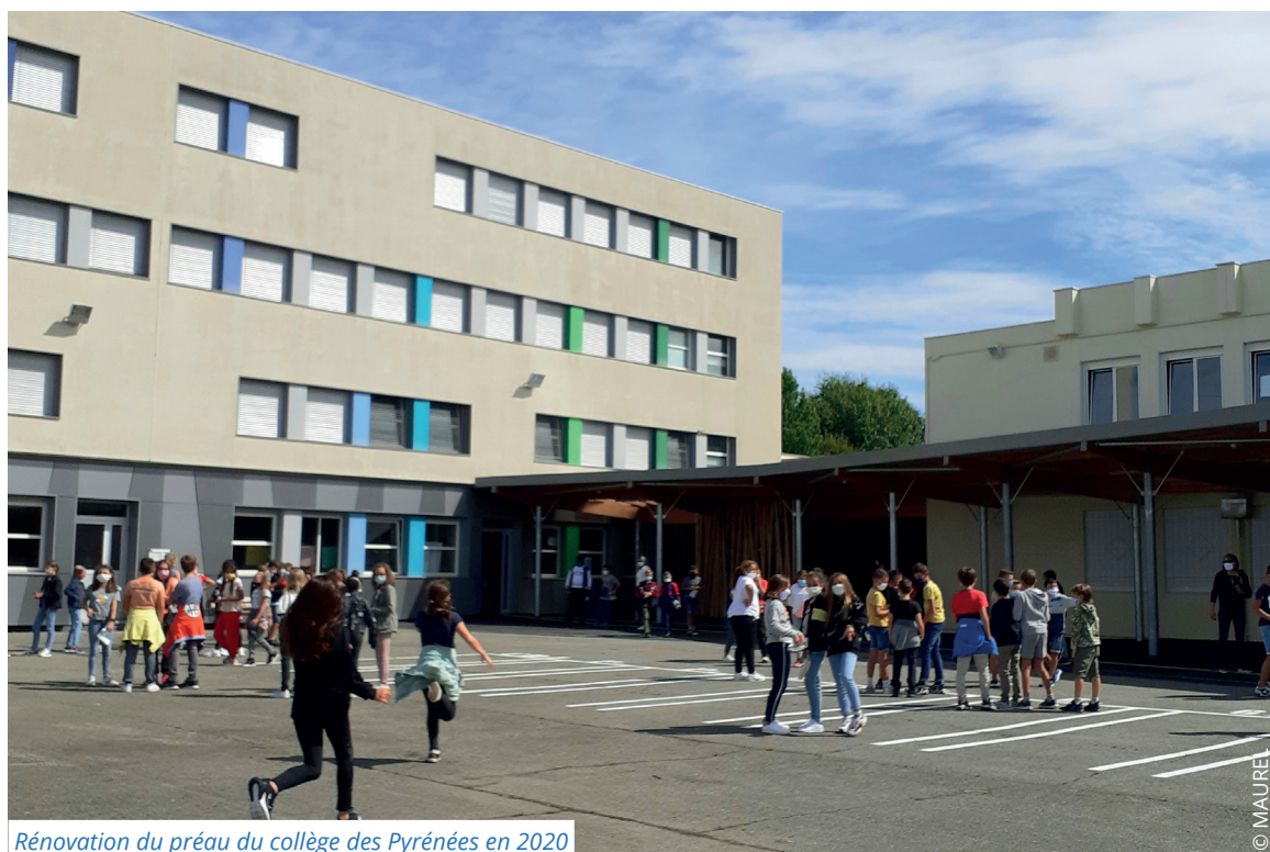
Rénovation du préau du collège des Pyrénées en 2020

Cette année, +1 M€ a été ajouté à l'enveloppe de travaux portant sur les bâtiments des collèges. Améliorer et moderniser les bâtiments publics contribue à développer l'activité économique au service de notre patrimoine immobilier. La rénovation énergétique est au cœur de ces travaux. En 2021 sont notamment prévues la rénovation thermique du collège de Lannemezan pour un montant de 1,2 M€ sur 2 ans et le remplacement de la chaudière au collège Voltaire (340 000 €).