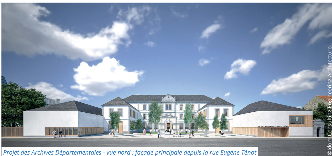
Projet des Archives Départementales - vue nord : façade principale depuis la rue Eugène Ténoc

Il s'agit de mobiliser l'ensemble des acteurs pour bâtir des actions au plus près des jeunes afin de répondre à leur besoin et leur donner envie de rester. Plus de 66 500 jeunes sont concernés.