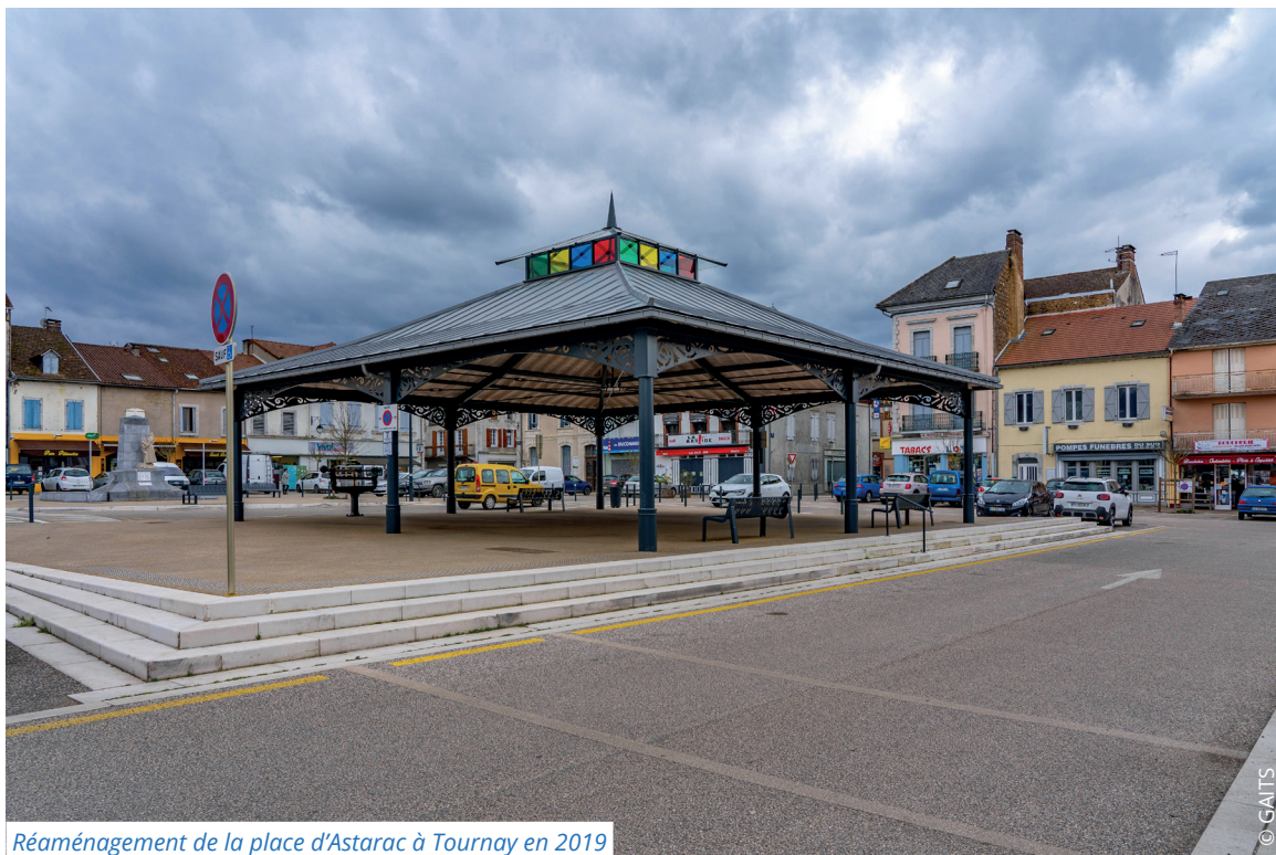
Réaménagement de la place d'Astarac à Tournay en 2019

Ce dispositif finance des aménagements améliorant la qualité de vie et les services aux habitants dont les plus fragilisés.