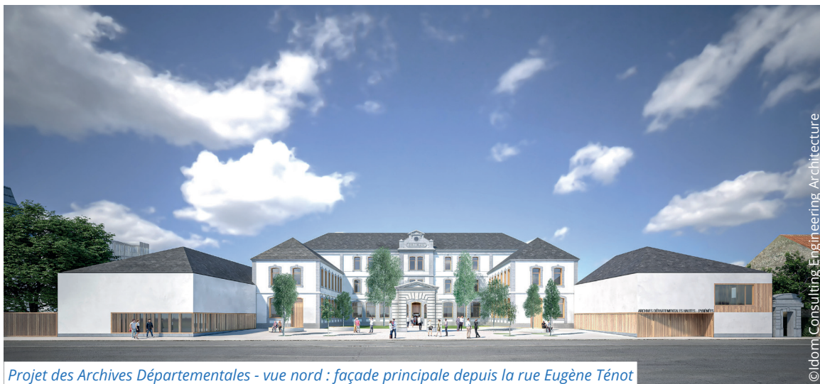
Projet des Archives Départementales - vue nord : façade principale depuis la rue Eugène Ténoc

Il s'agit de mobiliser l'ensemble des acteurs pour bâtir des actions au plus près des jeunes afin de répondre à leur besoin et leur donner envie de rester. Plus de 66 500 jeunes sont concernés.