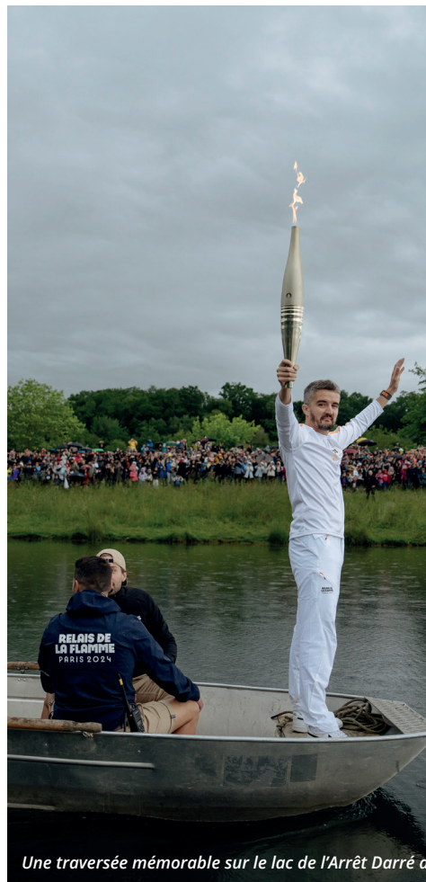
Une traversée mémorable sur le lac de l'Arrêt Darré