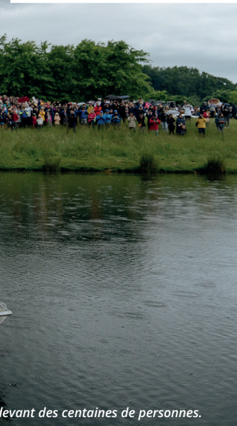
devant des centaines de personnes.