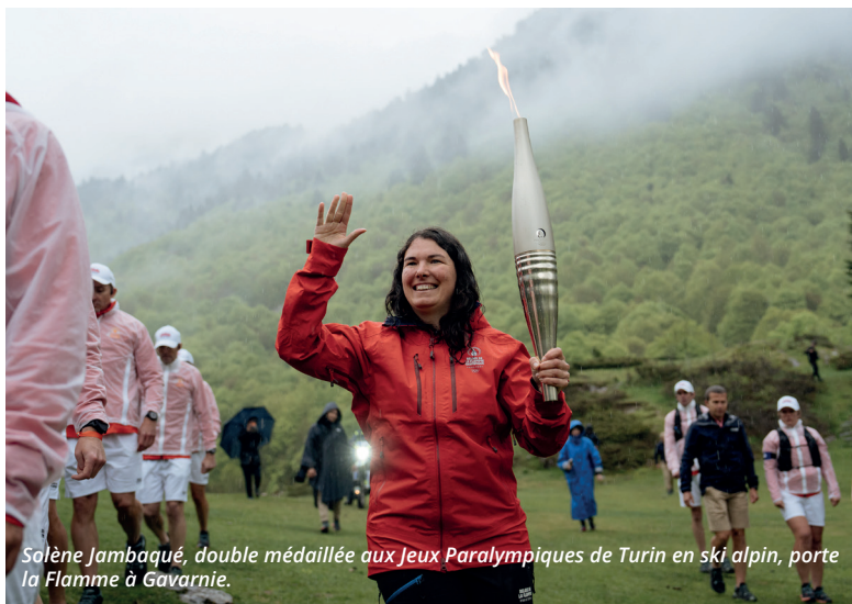
Salène Jambaqué, double médaillée aux Jeux Paralympiques de Turin en ski alpin, porte la Flamme à Gavarnie.