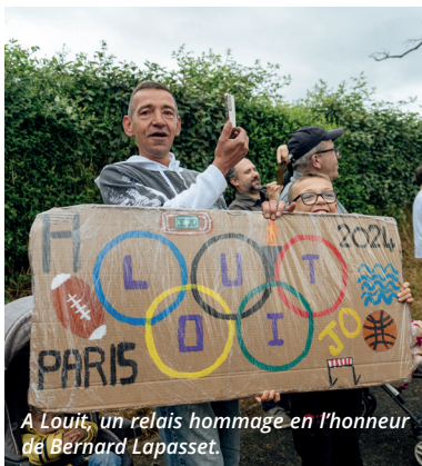
A Louit, un relais hommage en l'honneur de Bernard Lapasset.