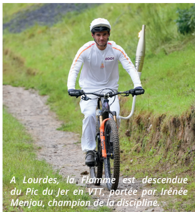
A Lourdes, la Flamme est descendue du Pic du Jer en VTT, portée par Irénée Menjou, champion de la discipline.

C'était le 19 mai 2024. Aux premières lueurs de l'aube, la Flamme Olympique a entrepris son voyage dans les Hautes-Pyrénées depuis le sommet du Pic du Midi. A Lourdes, Louit, Bagnères-de-Bigorre, Lannemezan, des milliers de personnes étaient présentes pour assister à l'événement.