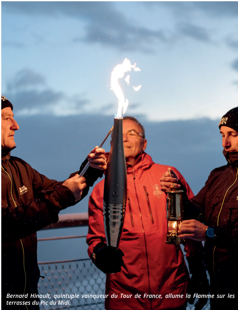
Bernard Hinault, quintuple vainqueur du Tour de France, allume la Flamme sur les terrasses du Pic du Midi.