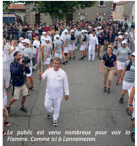
Le public est venu nombreux pour voir la Flamme. Comme ici à Lannemezan.